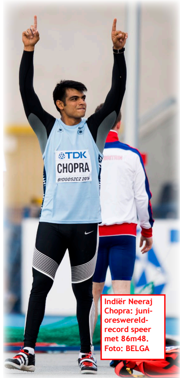
Indiër Neeraj Chopra: juniorswereld-record speer met 86m48.